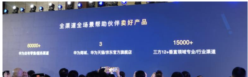
图 14：全渠道全场景帮助鸿蒙伙伴卖好产品

帮伙伴卖好产品 ：全渠道全场景帮助伙伴卖好产品，除了电商平台的华为旗舰店、华为商城，华为预计新增 15000 家第三方线下渠道店，帮所有的生态伙伴销售 HarmonyOS Connect 的产品。