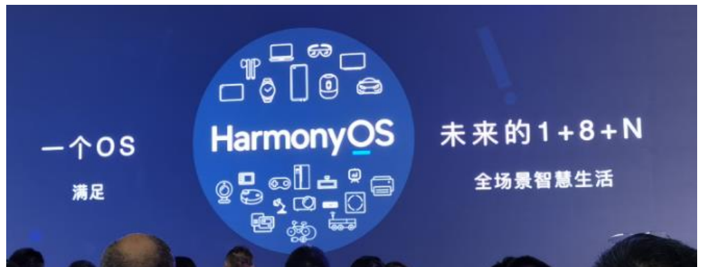
图 4: 一个 OS 满足未来 1+8+N 全场景智慧生活需求

华为给出了 HarmonyOS 的定义：为万物互联时代打造的智能终端操作系统。终端从传统设备，到如今的单点智能设备(比如智能手机)，再到未来的多设备协同的发展过程中， 鸿蒙为不同的设备智能化、互联以及协同提供了统一的语言，让多终端能够协同在一起，一起为消费者带来简捷、流畅、连续、安全可靠的全场景交互体验，实现一套系统能够满足所有智能硬件的要求。