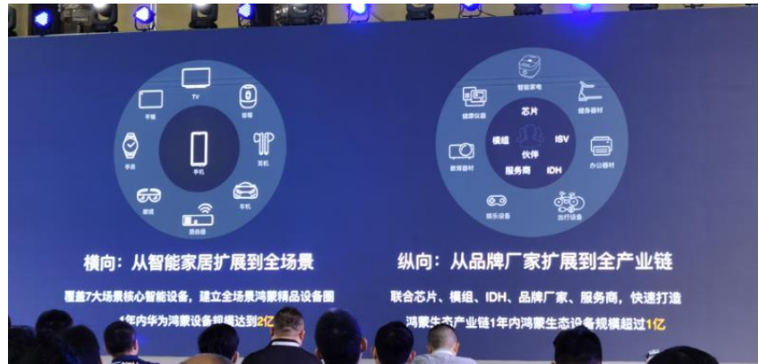
图 5：鸿蒙生态横向和纵向拓展方向