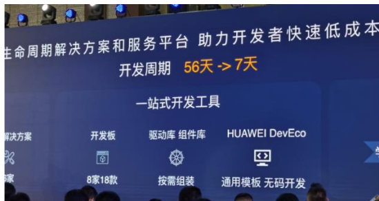
图 11：鸿蒙助力开发者快速低成本开发

华为提供了全栈的解决方案，一站式的研发工具。从芯片到操作系统，到上层服务软件的全栈的解决方案，让开发周期从 56 天降低到 1 周。