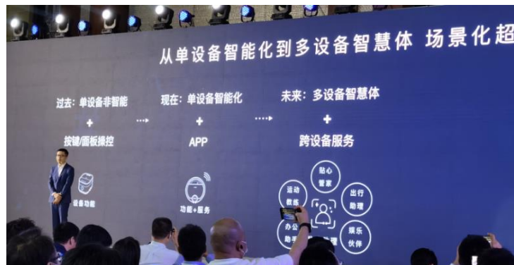
图 10：智能终端发展趋势，从单设备智能化到多设备智慧体

从传统设备到单点智能化到多设备智慧体，这是一个不可阻挡的趋势。以传统手机为例，在功能机时代，用户只能通过手机壳、挂链、手机铃声追求个性化；在智能手机时代，个性化得到了充分增强，手机通过 APP 实现了软件的个性化；而如今智能手机单体时代已见顶，手机用户量和 APP 使用时长已经触顶，单体机时代已经接近尾声。未来，要发挥多设备协同的优势，基于场景、多设备、互联能力给消费者提供极致体验，产生差异化。每一个场景中，鸿蒙都有产品组合，而不是单体产品。产品组合中，部分由华为自行研发生产，更多的则是生态伙伴做的产品。