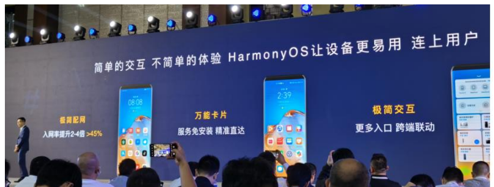
图 9: HarmonyOS 旨在让设备更易用，以简单的交互带来不简单的体验

华为认为，解决上述问题，是要解决怎么样更易用，怎么样更好用。搭载鸿蒙操作系统的设备，联网率提升 2-4 倍；万能卡片确保使用率和激活率大幅提升，免安装服务，秒开，精准直达；极简交互，带来更多入口，跨端联动。