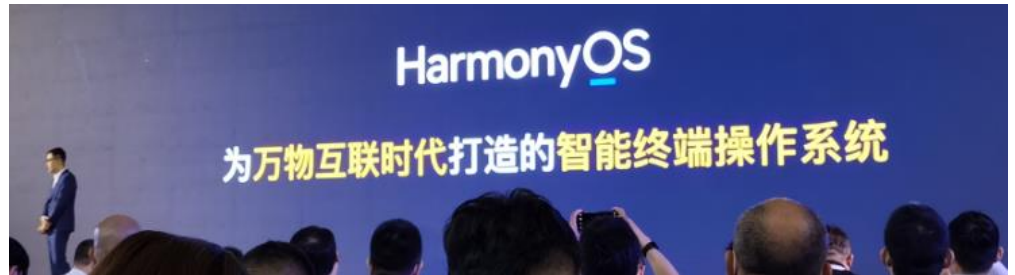
图 3: HarmonyOS 定义为万物互联时代打造的智能终端操作系统。