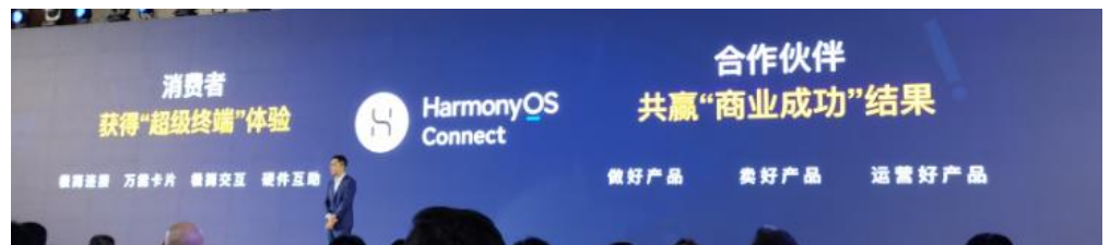
图 8: HarmonyOS Connect 赋予消费者、合作伙伴的价值

此次升级，并不是简单的文字变化，其内涵是做到 2 个升级：对消费者的体验升级，对生态伙伴的商业合作升级。消费者体验升级有 4 点内容：极简链接、万能卡片、极简交互、硬件互助，共同产生消费者的极致体验；对生态伙伴的商业合作升级，华为认为，转型做生态和做产品的最大的变化是首先要让生态伙伴赚到钱，让伙伴享受到商业价值。华为将从 3 个方面为鸿蒙生态伙伴提供商业价值：做好产品、卖好产品、运营好产品。