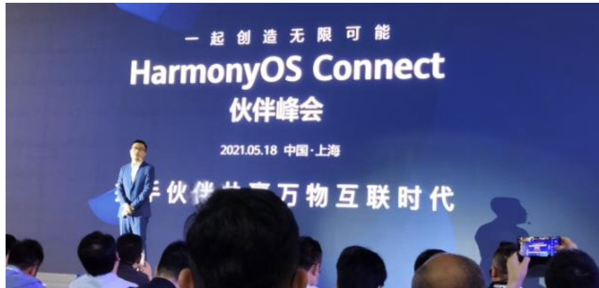
图 1：华为 HarmonyOS Connect 伙伴峰会：携手伙伴共享万物互联时代

2021年5月18日上午，华为在上海举办 HarmonyOS Connect 伙伴峰会。这是鸿蒙硬件生态品牌升级正式为 HarmonyOS Connect 品牌的正式发布会。鸿蒙生态战略可概括为： 以鸿蒙操作系统为技术的核心载体，与应用生态伙伴以及硬件生态伙伴一起，为消费者打造极致的终端体验。