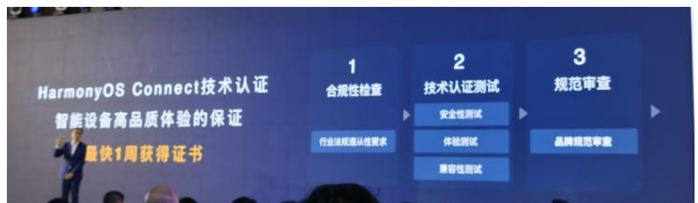
图 13：HarmonyOS Connect 技术认证周期缩短

认证周期缩短，最快一周获取华为的技术认证。结合前面的极速开发，意味着在极限情况下，从开始做产品到通过我们认证，鸿蒙伙伴最快只需要 2 周时间。