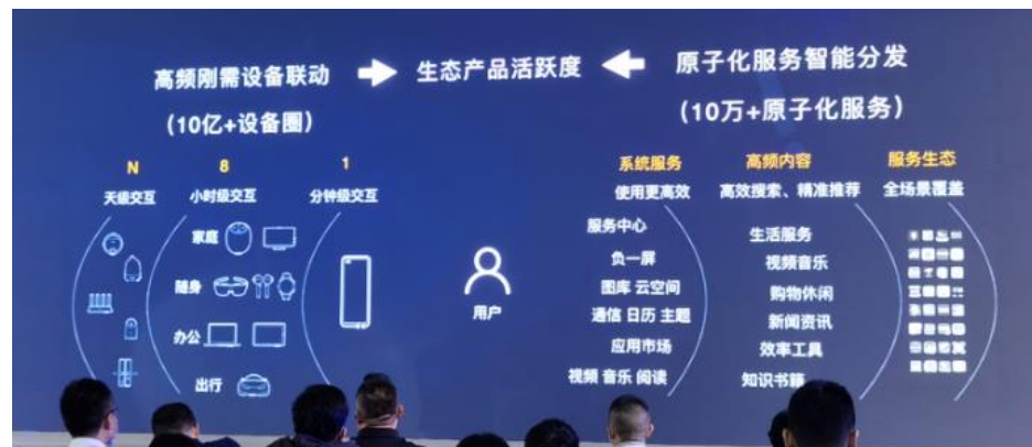
图 15：鸿蒙生态伙伴产品活跃度提升方式

通过高频刚需设备联动、原子化服务智能分发提升生态产品活跃度 。当前最高频的设备是手机，用户是分钟级交互时间，还有小时级(电视冰箱平板)，也有一些设备则是日级交互设备。鸿蒙用分钟级、小时级交互设备给日级交互设备提供高频的体验和互动。设备好用，也必须要有方便有效的服务能力，华为预计有 10 家以上的原子化服务加入华为生态。