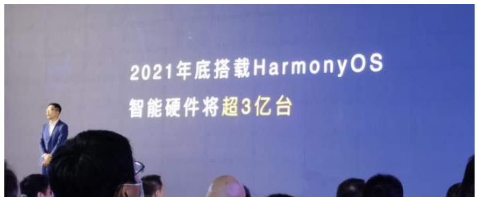
图 6：华为预计 2021 年底搭载 HarmonyOS 智能硬件将超 3 亿台