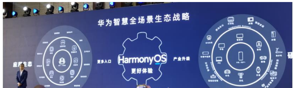
图 2：华为智慧全场景生态战略

未来 10~20 年，华为看好万物互联和数字化这 2 个趋势，原因为 3 点：1) 市场空间大，中国 AIOT 市场空间超过万亿；2) 万物互联时代，从单体设备向融合的多设备智慧体演进，终端的形态必然发生改变；3) 随着终端形态的演进，消费者体验和服务内容、形式也必然发生改变。