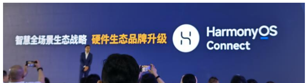
图 7：鸿蒙硬件生态品牌正式升级为 HarmonyOS Connect

同时，鸿蒙硬件生态品牌升级正式为 HarmonyOS Connect。这次升级意味着鸿蒙面向生态伙伴硬件产品做到 4 个统一：统一品牌、统一体验、统一方案、统一平台。